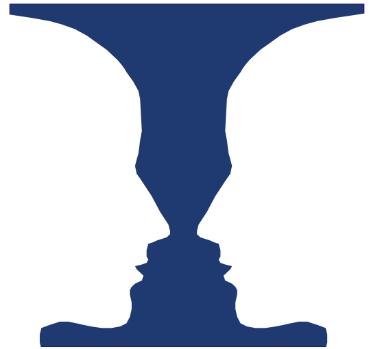
Figur 2: Rubins vase.

Rubins begreber kan dermed anvendes i en fysisk kontekst om det samlede hele, som netop oplevelsen betoner, men samtidig sondre mellem det primære fokus (figuren) og den omgivende sammenhæng (grunden). Dermed får Rubins figur-grund-teori i første omgang en væsentlig metodisk implikation: For sondringen mellem figur og grund anerkender, at det synsoplevede betragtes som et samlet hele, men at dele af dette hele tillægges en særlig betydning, og dermed fremtræder som figuren.