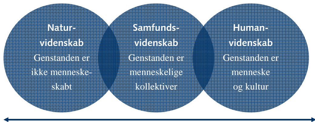
Figur 1: Natur-, samfunds-, og humanvidenskab. Egen model inspireret af Christensen (2003).

I den optik skiller naturvidenskaben sig ud som den videnskab, hvis genstandsfelt definatorisk er naturgivet, om end man må forudsætte, at også det naturgivne i større eller mindre omfang vil være præget af interaktionen med det menneskelige (som dog også er en del af naturen).